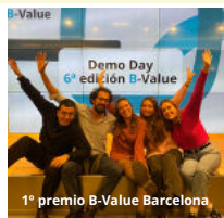
1º premio B-Value Barcelona

225 horas en total 90 minutos por familia