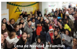
Cena de Navidad A+Familias